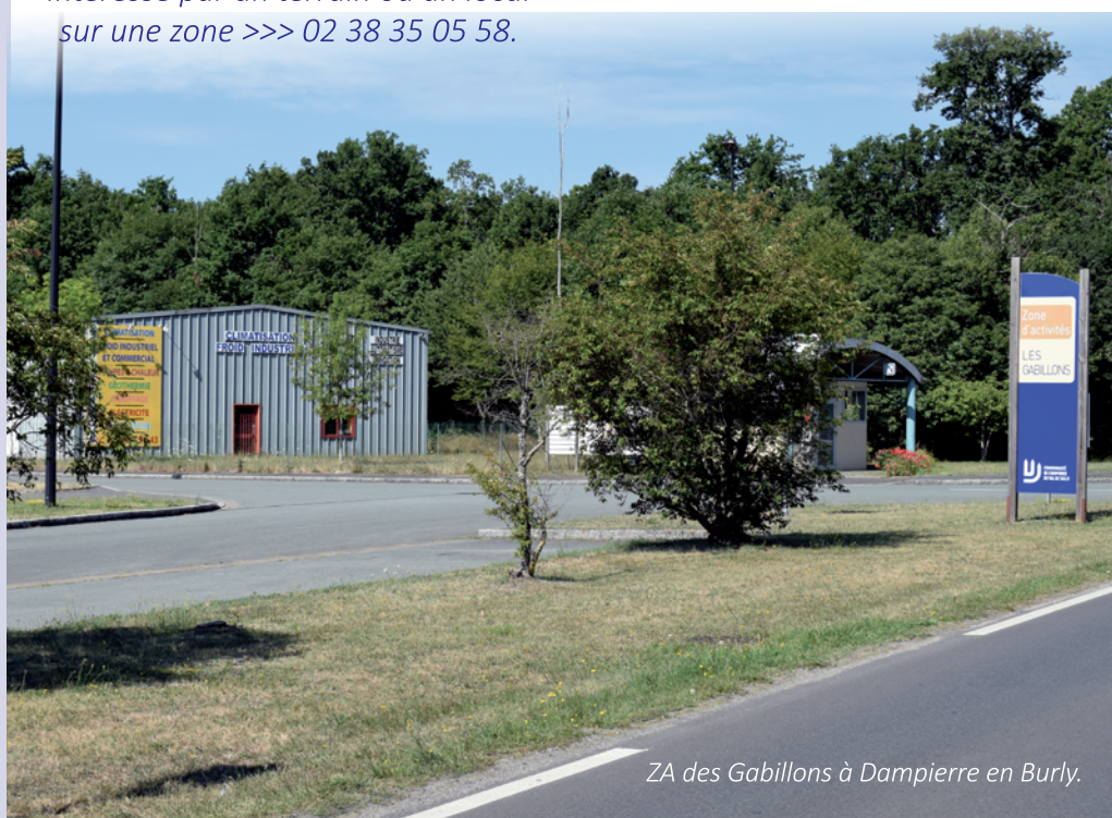
ZA des Gabillons à Dampierre en Burly.

Deux chantiers écoles ouvriront prochainement. L'un financé par la Communauté de communes - à but locatif - situé à la Jouanne et l'autre suite à la vente d'un terrain communautaire à la ZA des Gabillons qui permettra à la société Techman Industrie d'assurer la formation nécessaire à son activité.